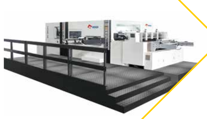
YOCO - JY 1650 يوجو جي واي 1650