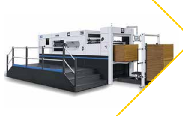
RUIYANG - MHC-1650 رويانغ أم أنش سي - 1650