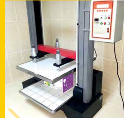
BCT TEST اختبار بي سي تي

بي سي تي: اختبار انخفاض الصندوق، إي سي تي: اختبار سحق مجرى طرف الصندوق، اختبار كوب: اختبار قياس نسبة رطوبة الورق / الكرتون، انكسار المادة الكيميائية المساهمة