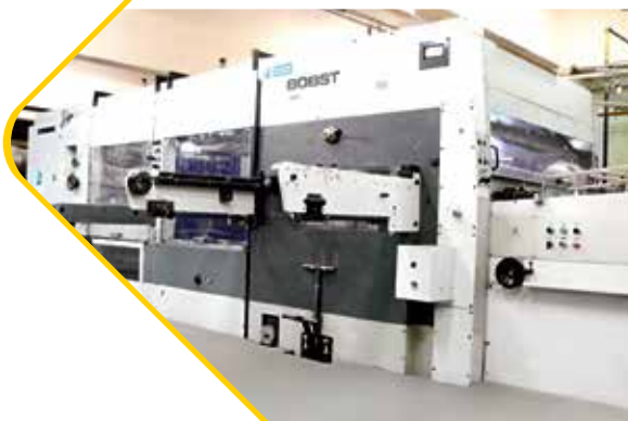
BOBST 142 - SP-142E بوب أس تي 142 أس بي- 142 إي