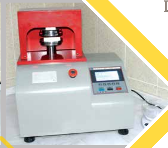
ECT TEST اختبار إي سي تي