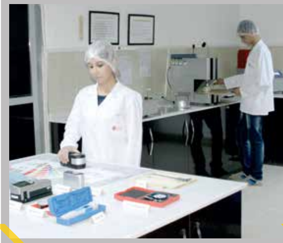
CRASH TESTS اختبارات التصادم