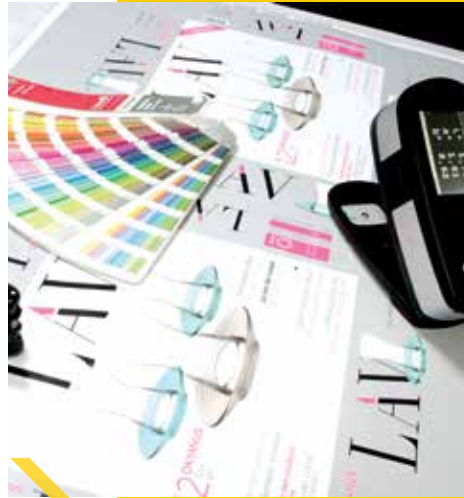
SPECTRAL COLOR قياس اللون الطيفي

VISCOSITY TESTS: Liquid fluidity test, SPECTRAL PHOTOMETER: Color measurement test, DENSITOMETER: Offset mould tram measurement RAW MATERIAL THICKNESS TESTS: VAPOR, TEMPERATURE AND HEAT TESTS: GLOSS MEASUREMENT / SURFACE BRIGHTNESS SHOREMETER: Hardness measurement / Softness measurement SPECTOPHOTOMETER: Color analysis, LAB, E measurement