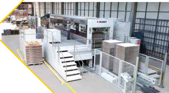
BOBST 145 - EXPERTCUT بوب أس تي 145 أكسبر

يتم قطع الغلاف العالمي بقوالب قطع معدة وفقا لمواصفات فيفكو. يتم الانتاج باستخدام 14 ماكينة قطع بالمجموع في جميع منشئاتنا.