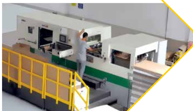
YOUNGSHIN - YT-1040 NCS يونغ شين واي تي 1040- أن سي أس