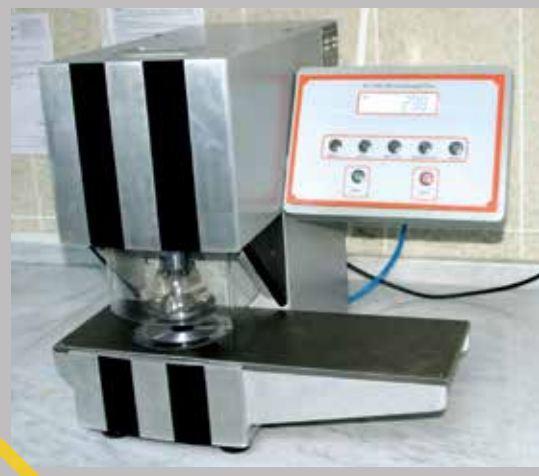
BURSTING TEST اختبار الانفجار