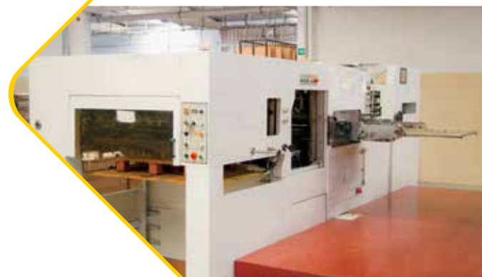
BICHENG - BC-1050 بيتشينغ بي سي 1050